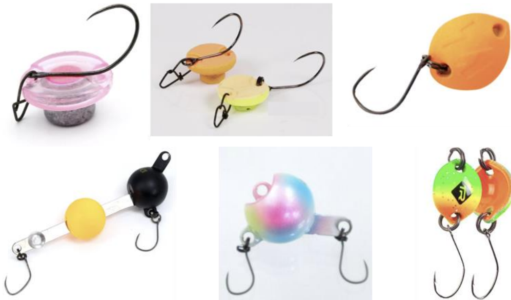
5. ábra: Példák a tiltott button és pinch csalikra.

19.4. Az úgynevezett „button” (gombszerű) és “punch” műcsalik használata tilos!