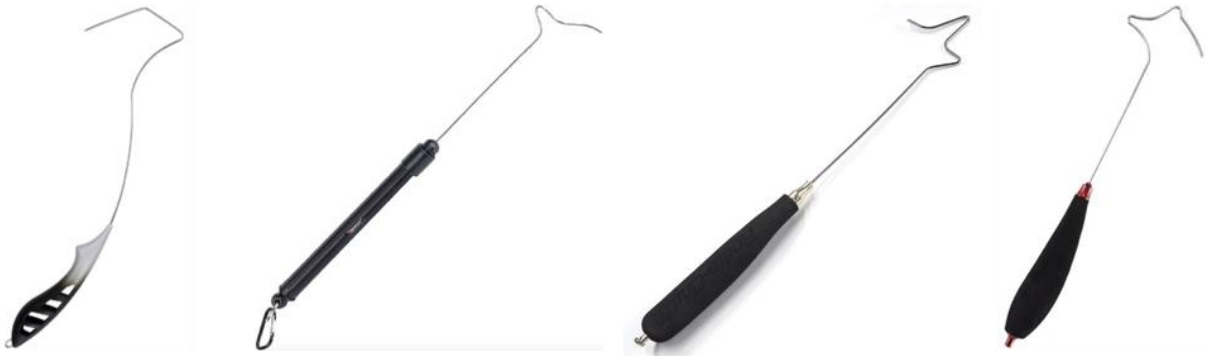
2. ábra: Releaser változatok

15. Horgászni csak az előre meghatározott boxokban más versenyzők zavarása nélkül, egyetlen kézben tartott bottal lehet. Amennyiben egy versenyző elé egy másik úgy dob, hogy a box képzeletbeli felezővonalát sérti, zavarja a horgászatban, azt a szabályosan horgászó az „OUT!” felkiáltással jelezheti. Ebben az esetben a zavaró versenyző köteles haladéktalanul kivenni, gyorsan kitekerni a szerelékét és újat dobni. Amennyiben a hibás dobás után közvetlenül nem jelzett a pálya-sértett fél, úgy később egy esetleges halfogás esetén ezt már nem róhatja fel ellenfelének. Lehetőség szerint az etap megkezdése előtt kéretik a felek között a vízfelületen és/vagy egy távoli fix pont között a parti felezővonal képzeletbeli összekötésével (a mindkét oldali szomszédos boxok figyelembevételével) konszenzust felállítani a kölcsönösen elfogadható boxon belüli felezővonallal kapcsolatban. Így később egyik fél sem róhatja fel ellenfelének mi “OUT” és mi nem “OUT”. Egyet nem értés esetén még az etap megkezdése előtt kötelesek a versenybírók, kinevezett versenybizottság legalább egy tagjának véleményét kikérni és azt kölcsönösen elfogadni.