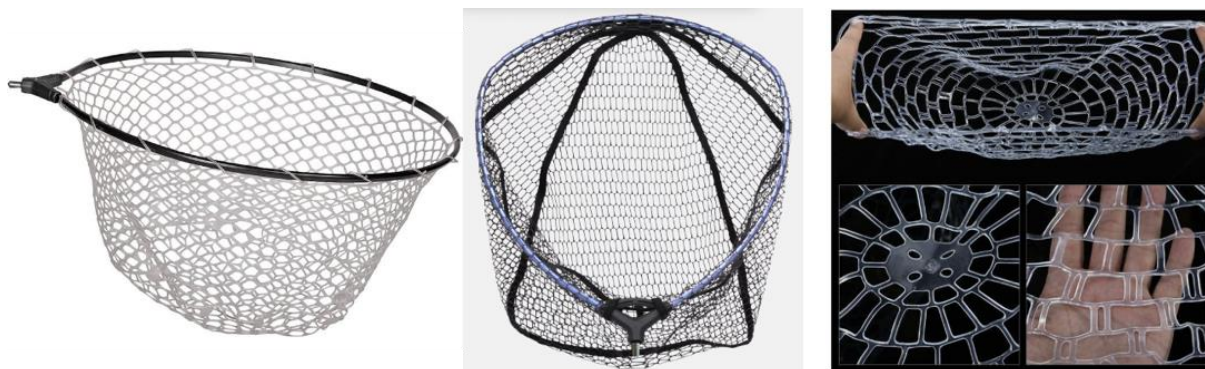
7. ábra: Engedélyezett merítőfej típusok

31. Merítőháló használata kötelező, amiről minden versenyző maga gondoskodik, és csak és kizárólag a halak sajátkezü merítéséhez. A szilikon, vagy gumihálóval szerelt merítő maximális hossza 2 méter lehet, a merítő fej külső átmérője nem haladhatja meg a 60 cm-t. Szilikon, vagy gumi bevonatú merítőháló elfogadott, de annak mindenképpen csomozásmentesnek kell lennie. Amennyiben a versenypálya adottságai miatt a versenyzők nem tudnak a vízhez kellően közel állni, úgy a verseny előtt a rendező engedélyezheti a hosszabb merítő használatát, de ez csakis külön felhívásban, a versenykiírásban kötelezően feltüntetve, minden nevezőt időben informálva engedhető meg.