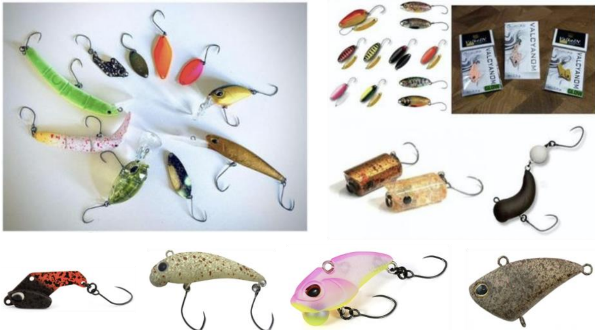
6. ábra: Példák az engedélyezett csalitípusokra

19.5. A teljesség igénye nélkül néhány engedélyezett, használható műcsali fotója (min. 18 mm):