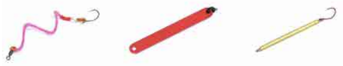
4. ábra: Példák a tiltott stick, tape és strip csalikra.

19.3. Bármilyen fém vagy műanyag „stick”, „tape”, „strip”, „stripe” (szalag, csík, pálca) csali és csalifüzér használata, annak hosszától függetlenül tilos!