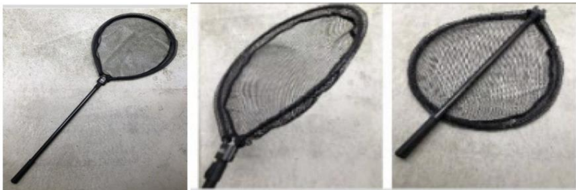
8. ábra: A tiltott lapos-hálós (ütős-hálós) merítőfej.

A hálónak legalább olyan mélynek kell lennie, hogy a nagyobb halak is biztonsággal elérjenek a háló alján, és ne tudjanak abból kiugrani. A lapos-hálós, úgynevezett ütő-hálós merítő használata tilos.