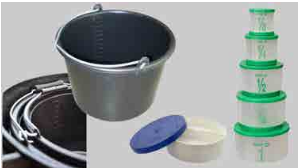
1. ábra: A megfelelő mérőedények és vödrök.