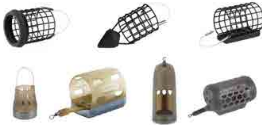
2. ábra: Tájékoztató ábra a megfelelő xetetőkosár típusokról.